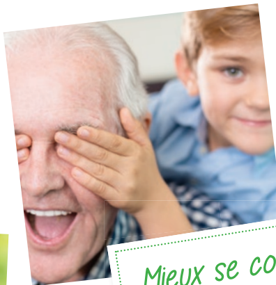
Mieux se connaître