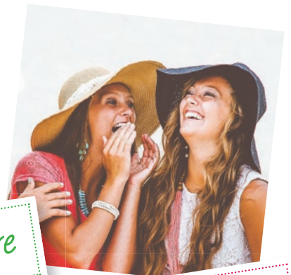
Echanger des paroles positives