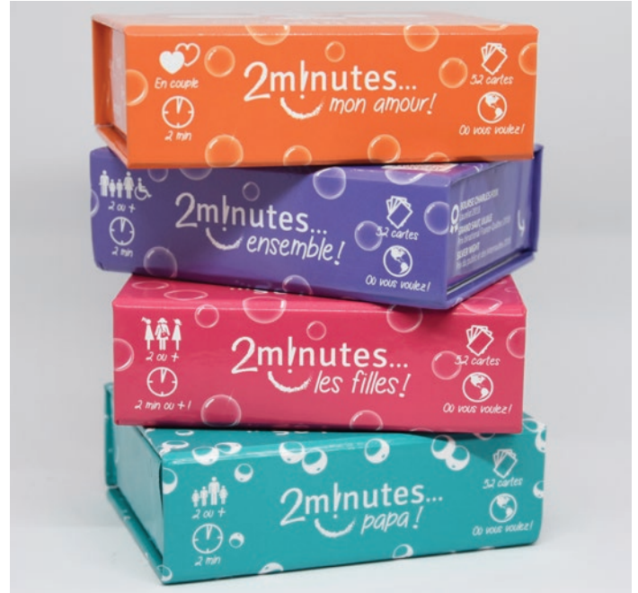
4 jeux pour multiplier les moments de complicité.

Chaque boîte est composée de 52 cartes. Sur chaque carte est écrite une phrase. Chacun y répond à tour de rôle en 2 minutes ou plus. Un dialogue positif s'installe autour de souvenirs, de pensées, de réflexions du quotidien ou de projets. Cela invite au dialogue et permet un échange autour de sujets originaux et bienveillants.