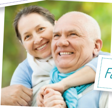
Faire pétiller le quotidien