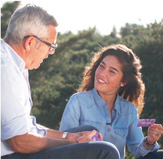
52 cartes pour créer du lien entre les générations et nourrir la conversation.