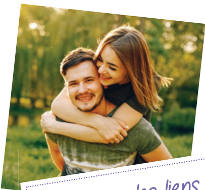
Renforcer les liens