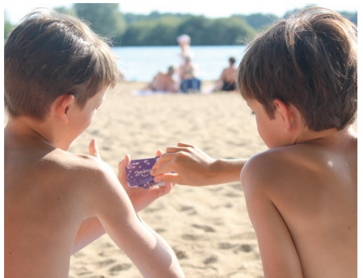
À la plage, en voyage... les jeux 2 minutes! ® s'emportent partout !

« Prononcer 3 fois plus de paroles positives que négatives améliore le bien-être... Ces cartes sont un excellent moyen d'atteindre ce ratio, de se focaliser sur le positif, de le partager et de le diffuser à son entourage ».